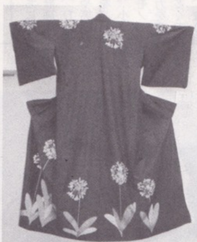
ファブリックペイントの新作（和服）

来年の2018年には、ドバイ（アラブ首長国連邦の首都）での作品展開催に向けて準備を進めている。